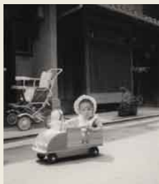
この頃から車の運転を