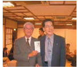
名コンビのお二人さん(1位)