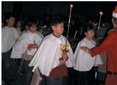
キャンドルサービス

12月24日の土曜日。今回のクリスマス例会は、例年になく寒い雪のちらつくロマンチックなクリスマスイブでした。子供達のキャンドルサービスが例会の始