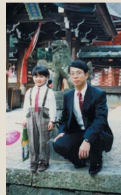
③ プーさん(?)との間に出来た一粒種。息子も今では18歳になりました。