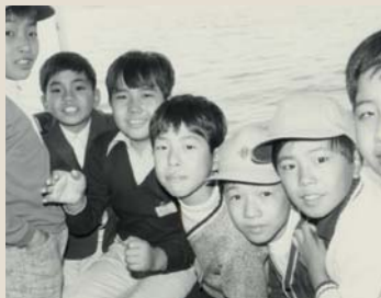
① 小学校6年生での伊勢志摩への修学旅行。何故かこの頃は皆、同じ顔をしています。