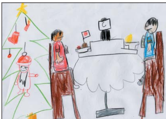
金田 知紘(ちひろ)君 (8才)