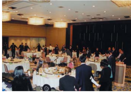
全員で手をつなぎエンディング「お正月の歌」を合唱