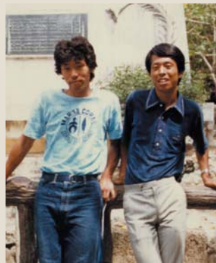
② 大学の卒業旅行。沖縄へ行きました。海が大好きで、ダイビングを始めたのはこの頃でした。