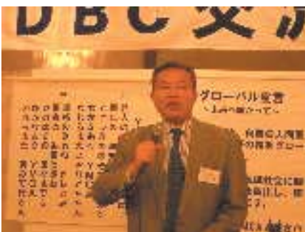
布田交流委員長(熊本)