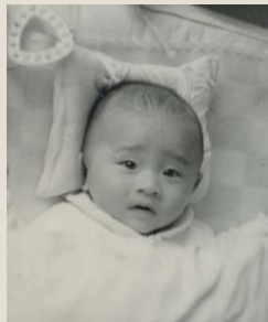
① S44.8.20 誕生致しました