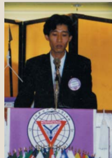
③ 今から約10年前ワイズではじめて委員長をさせていただき、みなさんの前でかなり緊張気味。（でも今でも緊張します。）