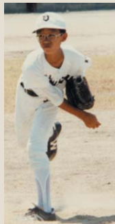
② 小学6年生の時（昭和57年）甲子園を目指し毎日野球の日々でした。かなり強かったんですよ。毎年京都の大会では上位入賞。